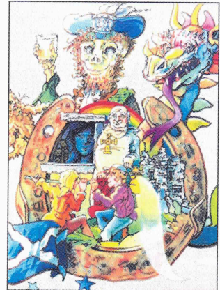
Eine von elf Illustrationen des Künstlers Markus Urfer.

Beim Erzählen zitiert Opapa auch einmal Hamlet: «Es gibt mehr Dinge zwischen Himmel und Erde, als eure Schulweisheit sich träumen lässt.» Der Shakespeare-Satz scheint bei der Lesung beim ganzen Publikum zu verfangen.