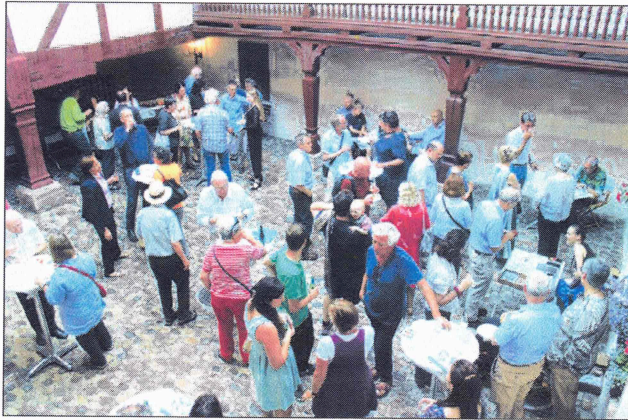
Grosses Interesse: Im Prattler Schloss konnte das Publikum Zeuge der Liebe des Autors zu den schottischen Traditionen werden.

«Zur Enttäuschung der einen nicht auf Englisch, dafür zur Erleichterung der anderen», erläutert der spürbar frohgelante Autor. Als Harry, das Gespenst, endlich seinen Seelenfrieden findet, schliesst das Buch doch noch mit einem englischen Satz in originaler Orthografie, nämlich dem Leitspruch der Urquarts: «Stand fast! Meane weil! Speak weil and doe weil!» Dazu wer-